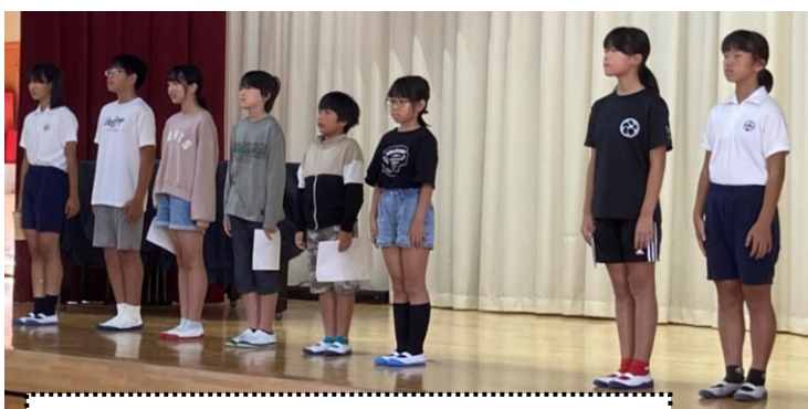
今の心境を全校児童に語った新旧役員交代式

4年生以上の熱い信任を受けて当選した 新児童会役員は、当選できなかった候補者 の志も胸に、前期役員のバトンを受け継ぎ、 心と力を合わせて、きっとよりよい中村小学校を創造してくれるものと期待します！